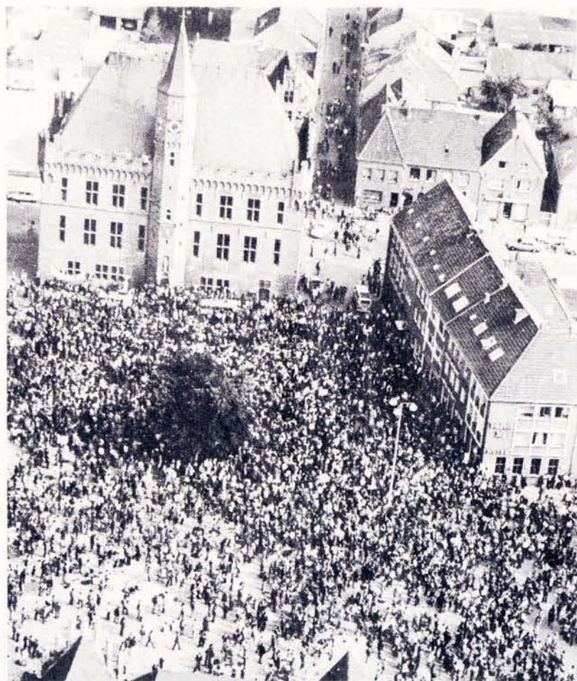
Rond de tienduizend mensen verzamelen zich op het marktplein van Kalkar op 24 september jongstleden. In totaal namen 35.000 mensen uit heel West-Europa deel aan de demonstratie.

Datzelfde geldt voor de CPN. Die maakte in het debat 'het Westduitse gevaar' tot hoofdzaak. Wolff stelde tijdens het debat op 31 januari: "Het is misleidend alleen of voornamelijk te praten over Brazilië, terwijl het eigenlijk gaat over West-Duitsland."